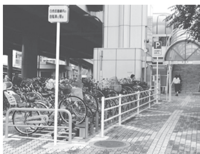
東口一時利用駐輪場

市民が声を上げ続けることで、生活環境は少しずつでも改善していきます。現在、来年度予算編成に対する要望書を作成中です。ぜひ皆さんの声を市民ネットワークまでお寄せ下さい。