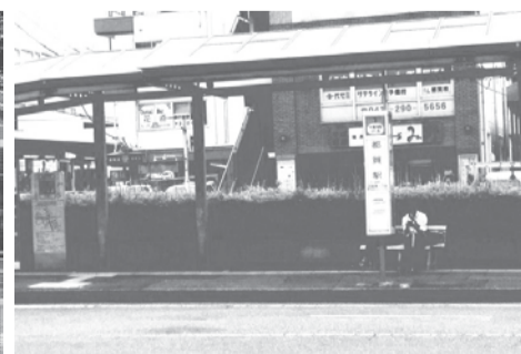
西口予定地（バス停後ろ低木植え込み地）