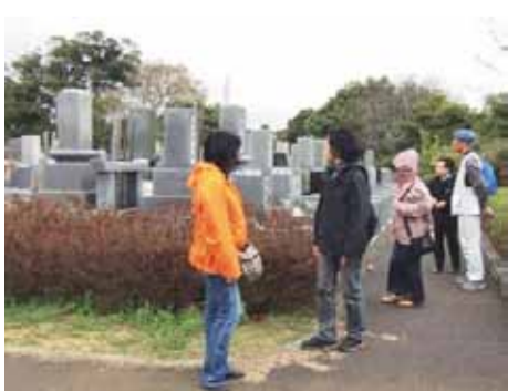
悪天候にもかかわらず参加して下さった皆さん