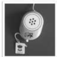
防犯ブザー 小中学生に貸与されています

っているとの事。しかし、「地域からのなり手が少ない」、「PTA役員への負担が大きい」など、うまくいっていない例も耳にします。 市はこの制度を全校いっせいに投げたまま、学校任せにしていますが、地域ごとに横のつながりが持てるように、コーディネートするのが市の役割ではないでしょうか。 地域住民、保護者の参加を得て、良い取り組みの事例を紹介しあえるような交流の場をつくるよう求めました。