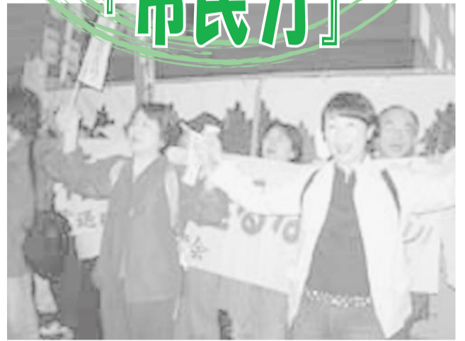
「教育基本法を変えないで！ヒューマンチェーン」のアピール