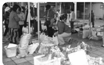
新鮮野菜がいっぱい ふれあい市