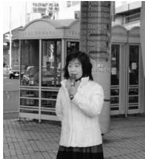
早朝の駅街頭演説

制度破たんが確実視されている議員年金制度存続を求める意見書を出したいという議長からの提案がありました。ネットはこれまでも制度そのものに反対してきており、議長提案にも反対。結局意見書提出は見送られました。