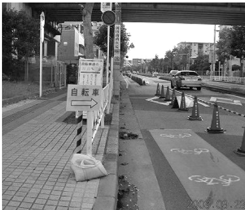
検見川浜駅周辺実験地