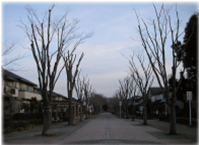
丸刈りにされたケヤキ並木

おゆみ野地区の住民にとって、四季の道は生活の場(通勤・通学・買い物や散歩など)として親しまれ、特に夏の道のケヤキ並木は、豊かな緑と居心地の良い木陰を与えてくれ、晩秋からは柔らかな日差しを運んでくれる貴重な居心地のよい場所でした。 昨春秋、一部の近隣住民からの強いクレーム(作業をしていた現場責任者はそう云っていました)でケヤキ並木の一部が7～8mの高さで丸刈りになり、今年の夏は何の並木か分からないような惨めな姿をさらしていた事はご存知の方が多いかと思います。 12月4日その変形並木の一部を業者が切っていたので、市公園管理課と緑の協会に聞いてみました。公園管理課は「元の形に戻るから...他の箇所でも切り下げて欲しいと言う住民の声が...」、緑の協会は「住民からのクレームで切ったのではない。市の予算がなくケヤキ並木の管理が出来なかった。ケヤキが大きくなり過ぎて、この段階ではマニュアルに従って強剪定をせざるを得ない。見苦しいが時間をかけて形を戻す。樹高は近隣住宅の高さが10mなので12mにする。道幅は19mあるが立派なケヤキ並木を作るためには不十分。云々」だと。 噛み合わない両者の説明で計画性・管理責任など割り切れぬものが残ります。要は住民もお役人もケヤキの心が分かっちゃいない。 おゆみ野住民の貴重な財産を損なわぬよう皆の知恵と意見を出し合ってケヤキとの共生を考える時のようです。 林