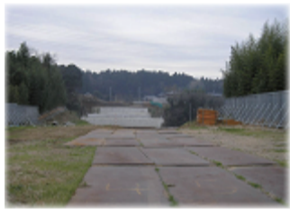
大木戸工区の八幡橋

都市計画道路についてのご意見をお待ちしています。右下のアンケートをご利用ください。