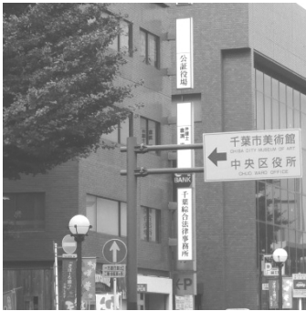
公証役場が入っているビル

中央区中央3-11-11 ニュー豊田ビル 4階 電話 043-227-3661 京葉銀行本町支店 隣り