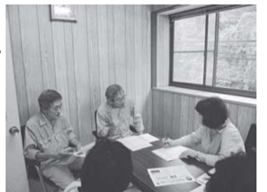
中央区の営業所を訪問

◆ スーパーマーケット 11 社に聞き取りしました ・・・マイバッグ持参のPRや、レジ袋辞退で1～2円の値引き、ポイントカードなどさまざまなサービスを実施しており、実績を店舗内に公表しているところもあります。お客さんはおおむね協力的とのこと。レジ袋の削減は徐々に進んでいます。コンビニでも7社中4社がPRポスターを貼るなど努力していることがわかりました。