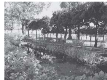
鶴沢小学校脇のせせらぎ水路

土木的な環境創出ではなく、休耕田を利用したピオトープづくりなどを広めていくことも大切です。