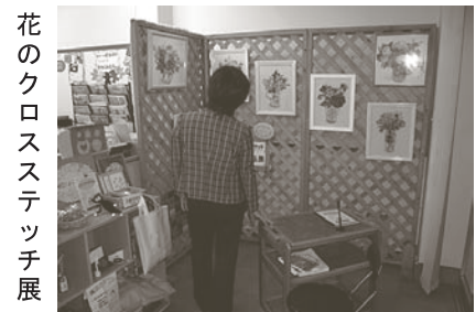
花のクロスステッチ展

手づくり作品展を開催しています。ぜひ事務所にお立ち寄り下さい。委託販売もできます。